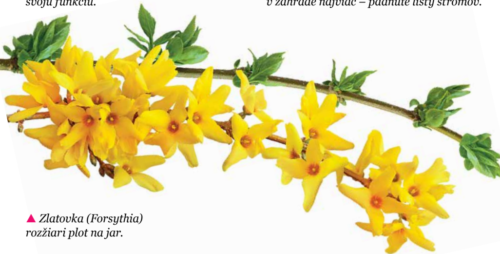
▲ Zlatovka ( Forsythia ) rozžiari plot na jar.