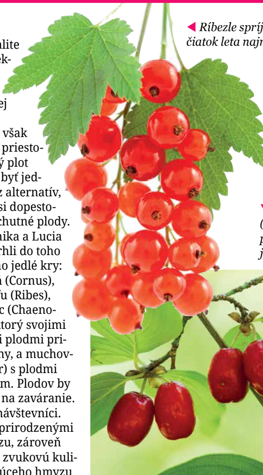
◀ Ríbezle spríjemnia začiatok leta najmä deťom.

O živý plot sa treba starať. Rovnako ako záhradu s trávnikom treba kosiť... Starostlivosť o živý plot pritom nie je až taká náročná. Ak máme požiadavky na výšku plota alebo ho túžime mať pravidelne kvitnúci, je potrebný minimálne presvetľovací rez. A nemali by sme zabúdať ani na vystrihávanie odumretých a odkvitnutých častí.