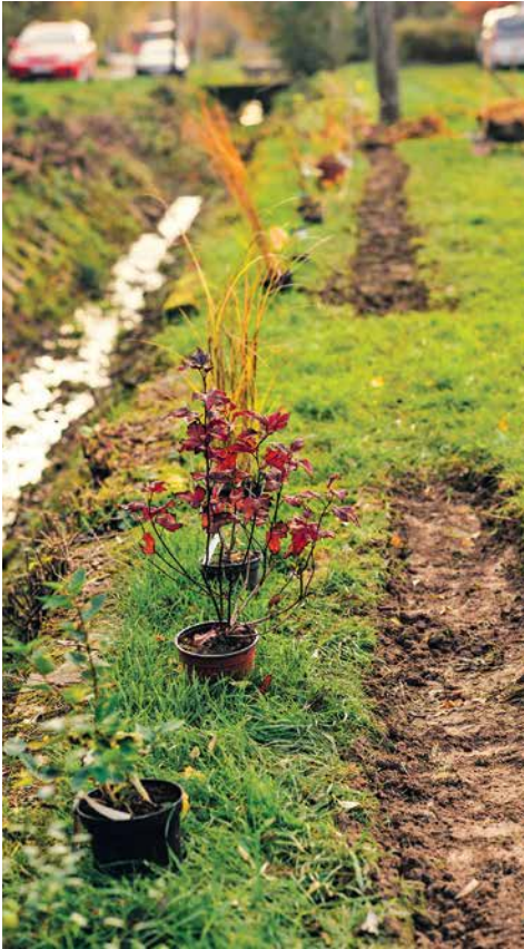
▲ Kríkom bude trvať asi dva roky, kým sa zapoja do živého plota a naplno začnú plniť svoju funkciu.