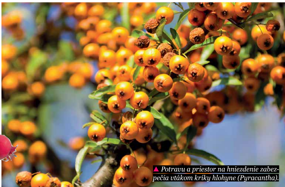
▲ Potravu a priestor na hniezdenie zabezpečia vtákom kríky hlohyne ( Pyracantha ).