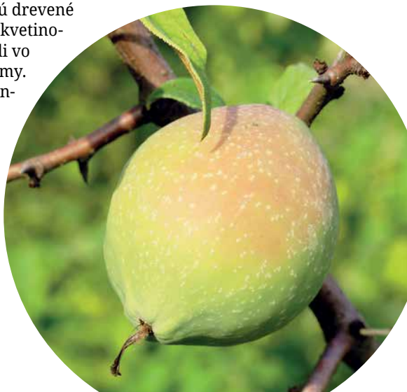
▼ Plody dulovca ( Chaenomeles ) možno využiť napríklad na prevonanie šatníka.