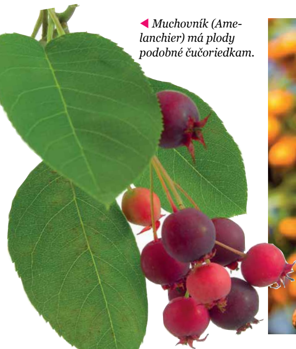
◀ Muchovník ( Amelanchier ) má plody podobné čučoriedkam.