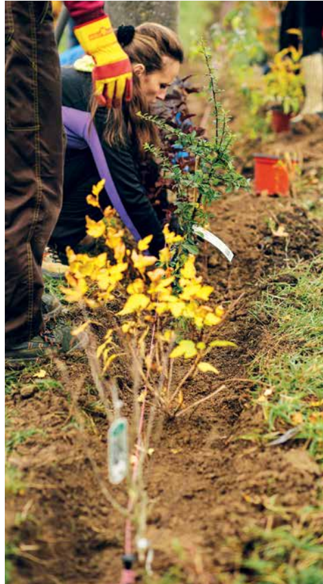
▲ Kríky sme sadili na jeseň, preto sme na záver využili na zamulčovanie to, čoho bolo v záhrade najviac – padnuté listy stromov.