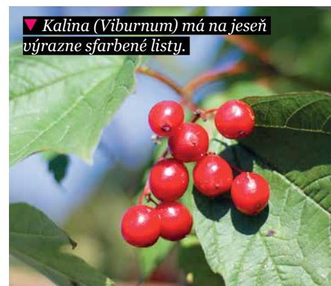
▼ Kalina ( Viburnum ) má na jeseň výrazne sfarbené listy.