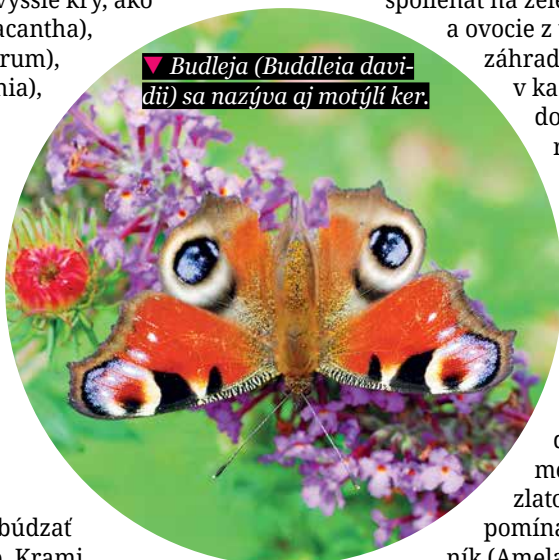
▼ Budleja ( Buddleia davidii ) sa nazýva aj motýľí ker.

Záhradné architektky si pripravili projekt, v ktorom navrhli plot v rôznych výškových úrovniach: od 1,5 m až do 3 m. Nakombinovali vyššie kry, ako sú hlohyňa ( Pyracantha ), vtáčí zob ( Ligustrum ), zlatovka ( Forsythia ), pajazmín ( Philadelphus ), a nižšie, z ktorých vybrali dráč ( Berberis ), vajgela ( Weigela ) a svíb ( Cornus ), tak, aby si netienili a neobmedzovali sa v raste. Zlatovkou a orgovánom ( Syringa ) sa plot začne na jar prebúdzat do prvých farieb. Krami kvitnúcimi v lete (budleja, vajgela, pajazmín) bude postupne ožívať do plného rozkvetu a plodov. V jeseni ozdobia živý plot zlaté a červené farby listov zlatovky a vajgely. Keďže v zimnom období v našich podmienkach nekvitne až také množstvo krov vhodných do živého plota, záhradné architektky navrhli kry s farebnou kôrou (svíb ( Cornus )) a plodmi, ktoré na kríkoch zostávajú až do neskorej zimy (hlohyňa, imelovník), a vždyzelené kry (vtáčí zob, kalina, hlohyňa), ktoré majú listy na konároch po celý rok. Aby koncept pestrého plotu nepôsobil chaoticky, zjednotili ho nepravidelným opakovaním sa niektorých druhov kríkov. Vysoké okrasné trávy ozdobnice ( Miscanthus ) plot zasa prevzdušnia a dodajú mu dynamiku. Trávy lákajú na dotyk, pohladenie. Oblúbené sú najmä medzi deťmi. Asi preto, že vo vánku či vetre sú rovnako živé ako ony same.